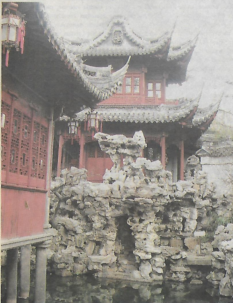
Skaistie ķīniešu dārzi...