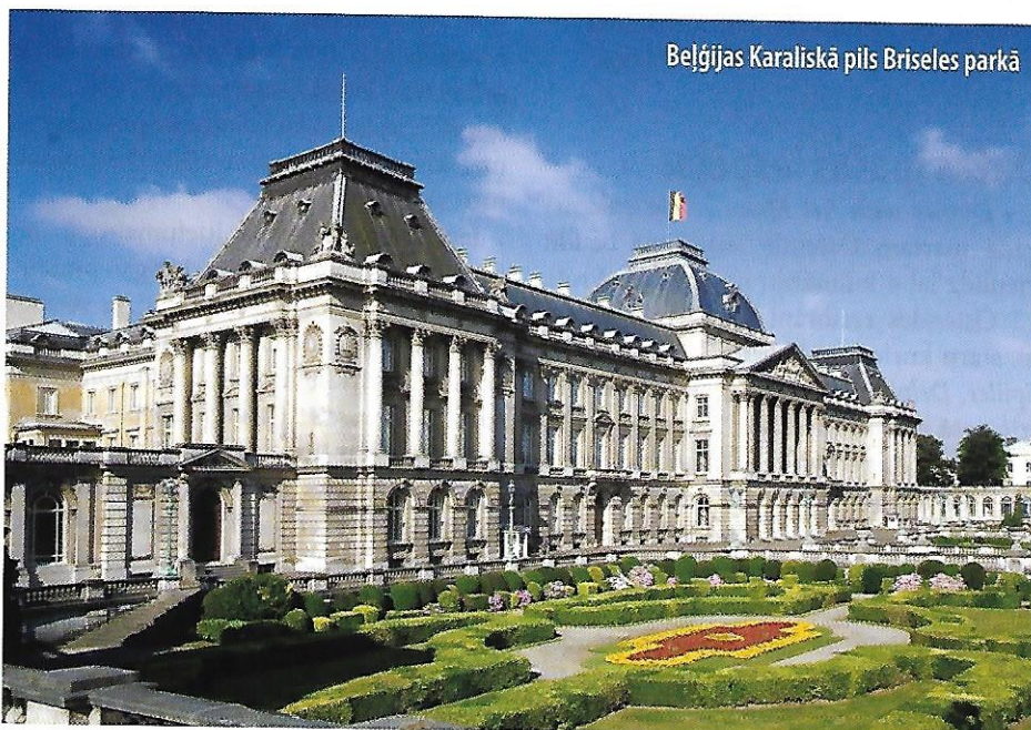
Beļģijas Karaliskā pils Briseles parkā

Ostende ir vieta, kur pēc neilga pārbrauciena no Briseles nokļūt pilnīgi citā pasaulē, kas ar tradicionālo priekšstatu par Beļģiju pārāk nesaistās. Salīdzinājumā ar Beļģijas tūrisma citadelēm – Ģenti, Briģi un Antverpeni – Ostende ir arī mazāk zināma, lai gan tas nebūt nenozīmē, ka tur nav nekā ievēribas cienīga – vismaz vienas dienas apmeklējumam Ostende būs tieši laikā.